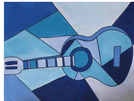
Guitare bleue. Picasso œuvre de référence