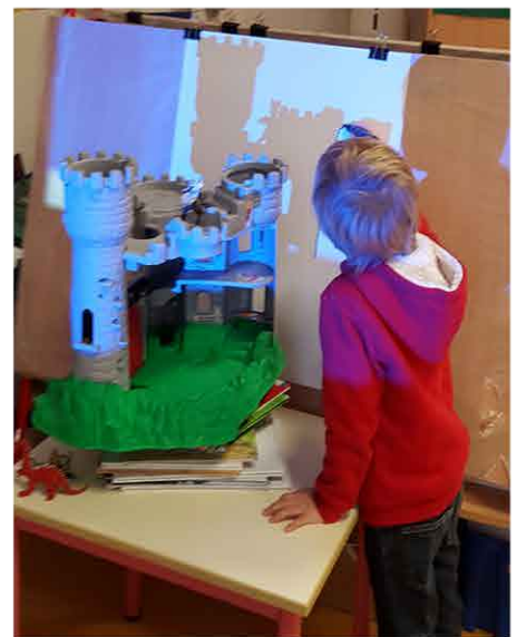
Pour ce grand château, proche du support(rétrécir).

Bilan : + simple avec des objets de tracer le contour.