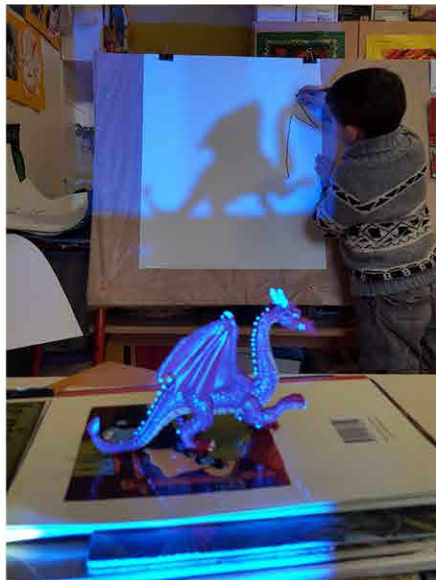
Pour un petit jouet, éloigné du support(agrandir)