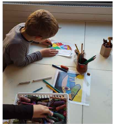
Tracer les zones/ colorie